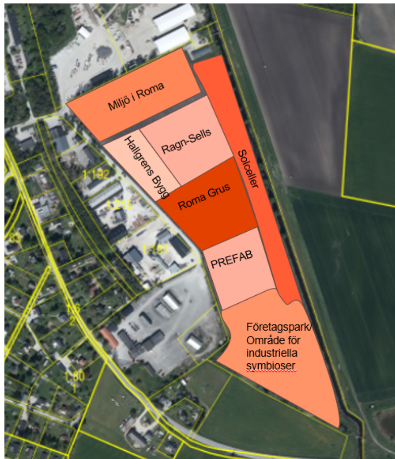
Figur, förslag om möjliga etableringar vid en framtida företagssymbios